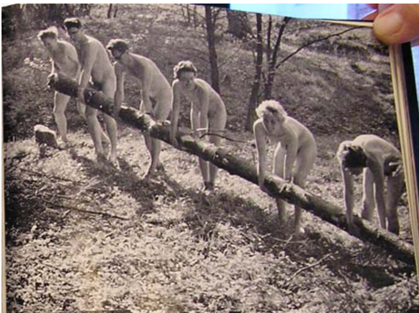
Lars medlem nr. 792

Engang omkring år 2003 ophører man med at have poletter for varmt vand til brusebad og det kan nævnes at i 1996 kostede 1 polet 4 kr. – 10 poletter 30 kr. og returprisen var 3 kr. og der var ikke tid nok til et bad med 1 polet. Til sammenligning var overnatningsgebyret for et medlem 25 kr.